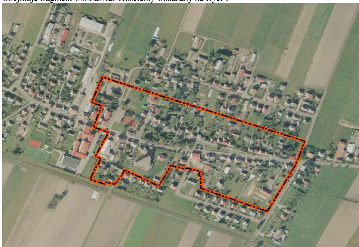
Ryc. 1 Zasięg układu ruralistycznego wsi Zawidz Kościelny

Obejmuje fragment wsi Zawidz Kościelny wskazany na Ryc. 1