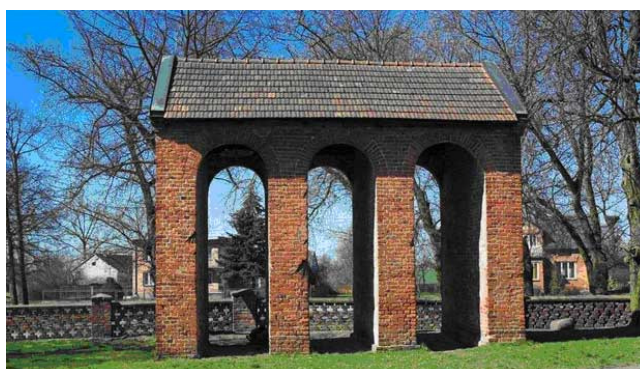
Fot. 13. Dzwonnica przy kościele św. Katarzyny w Łęgu Probstwie