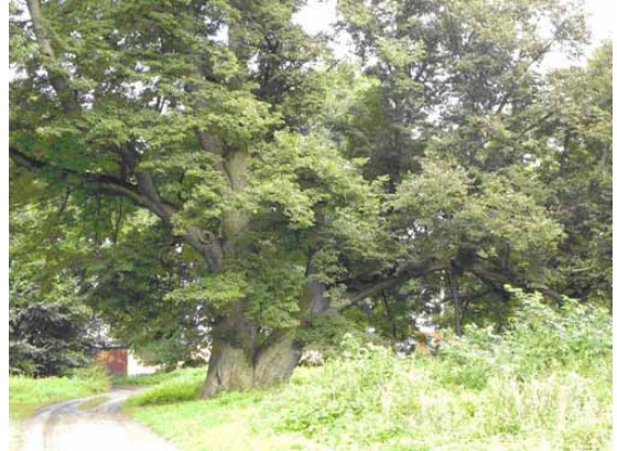
Fot. 2. Lipa, przy drodze Drobin-Raciaż, w miejscowości Karsy