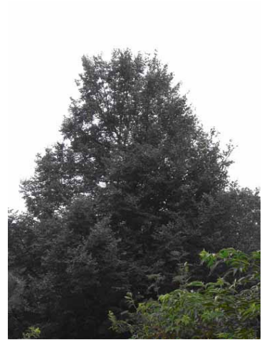
Fot. 3. Lipa w parku w miejscowości Karsy