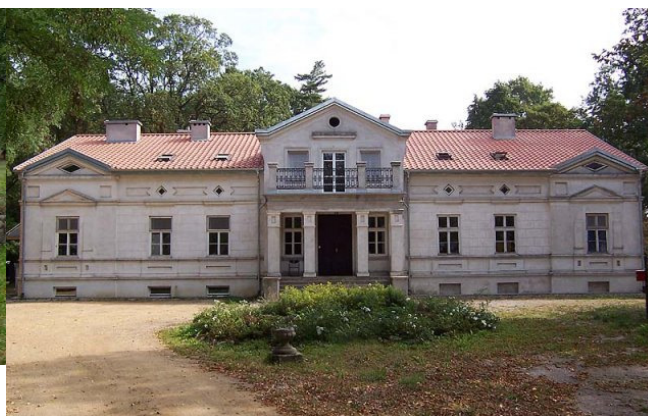
Fot. 11. Dwór w Kucharach