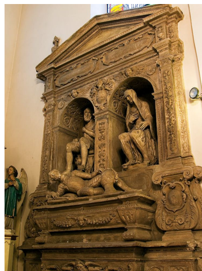
Fot. 7. Renesansowy nagrobek rodziny Kryskich w kościele parafialnym w Drobinie