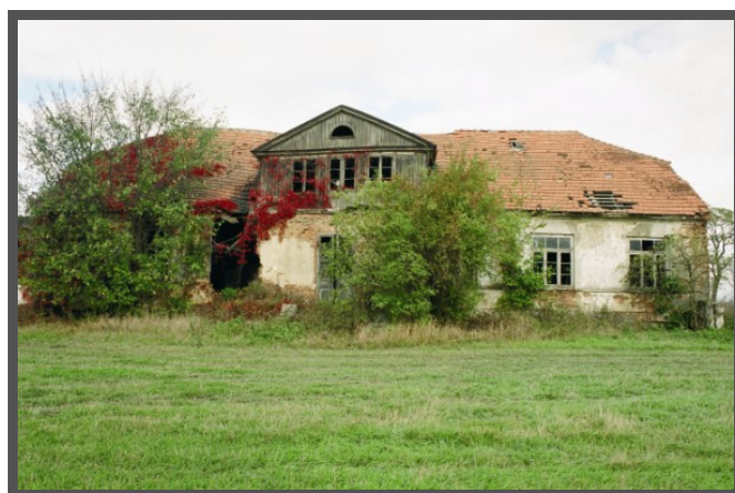
Fot. 9. Pozostałości dworu w Kowalewie