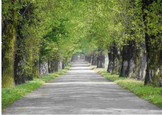
Fot. 1. Aleja topolowa wzdłuż drogi powiatowej Drobin – Koziebrody