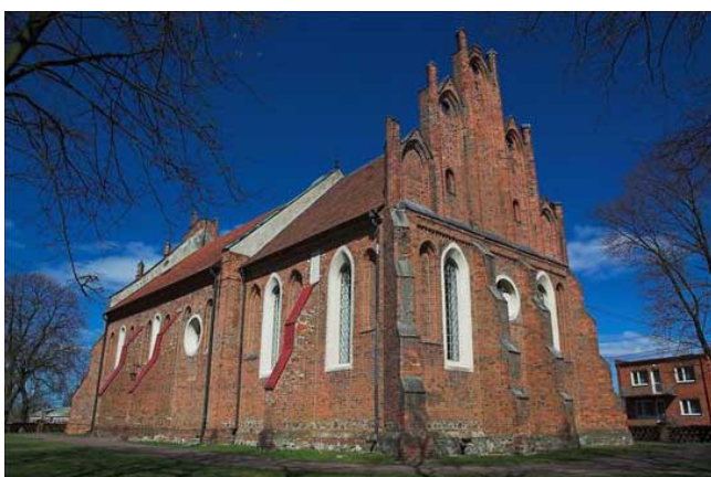
Fot. 12. Kościół pw. św. Katarzyny w Łęgu Probstwie