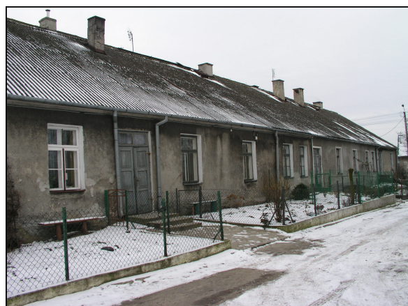
Fot. 8. Dawny zajazd murowany w Drobinie