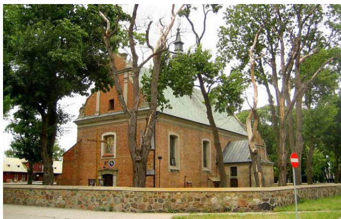
Fot. 6. Kościół parafialny w Drobinie