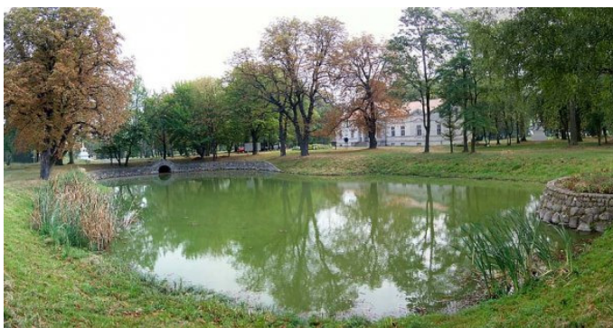
Fot. 10. Dwór wraz z parkiem krajobrazowym w Kucharach