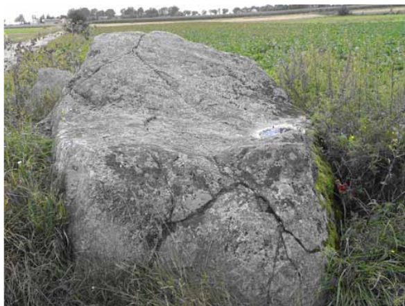
Fot. 4. Głaz narzutowy w Kozłowie