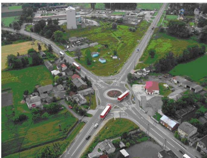
Fot. 15. Skrzyżowanie ul. Płockiej (DK nr 10) z ul. Marsz. Piłsudskiego (DK nr 60)

Znaczenie ponadlokalne posiadają również drogi powiatowe, o łącznej długości 50,703 km w granicach Gminy: