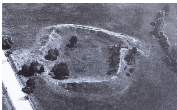
Fot. 14. Grodzisko w Mokrzku (1959-1960r.)