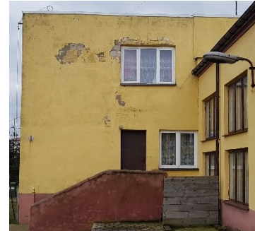
Elewacja W (część mieszkalna)