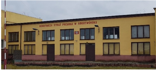
Elewacja N (OSP)