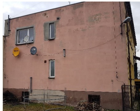
Elewacja S (część mieszkalna)