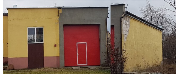
Elewacja W (OSP)