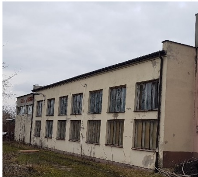
Elewacja S (OSP)