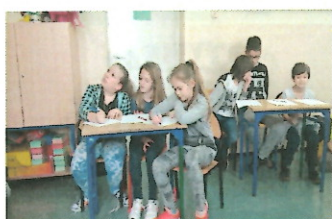
Marzec miesiącem matematyki...