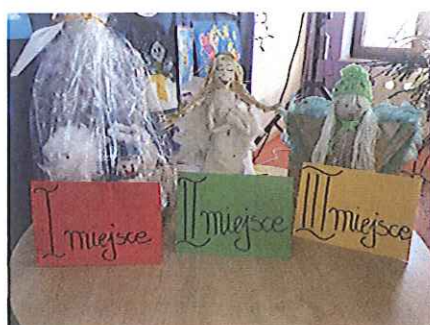
Sukces naszych przedszkolaków