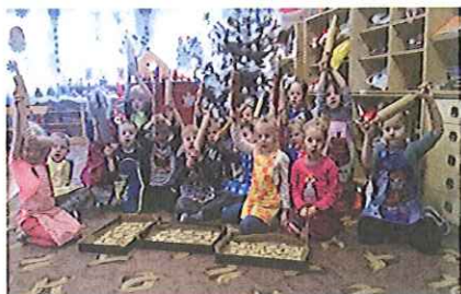
Przedkolaki pieką ciasteczka