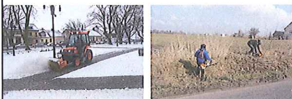
Spółdzielnia Socjalna Osób Prawnych "Centrum Usług Środowiskowych"